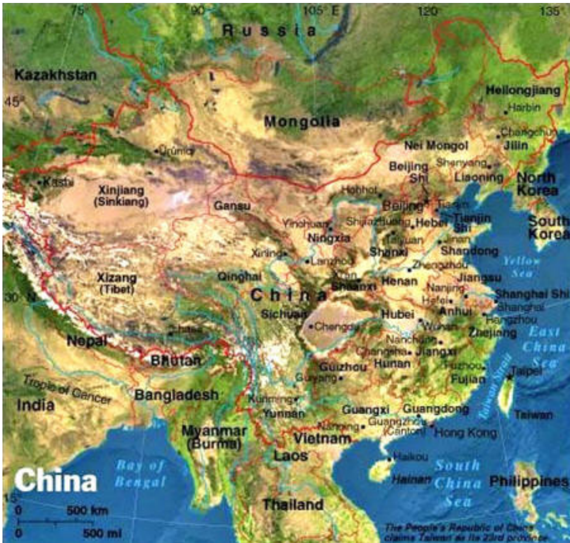
Figura C Área de la Base China