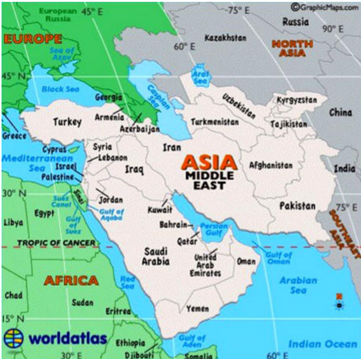
Figura D Área de las Bases de Medio Oriente y China